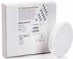
Initial Zirconia Disk