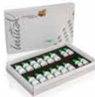
Initial Zirconia Coloring Liquids