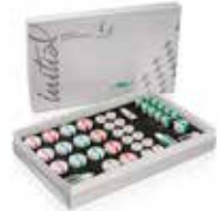
Initial IQ ONE SQIN

GC EUROPE N.V. • Researchpark • Haasrode-Leuven 1240 • Interleuvenlaan 33, 3001 Leuven • Belgium Tel. +32.16.74.10.00 • Fax. +32.16.40.48.32 • info.gce@gc.dental • https://www.gc.dental/europe