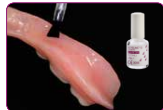
Breng GC RELINE II PRIMER aan op het gebied dat gerelined moet worden. Droog voorzichtig met lucht.