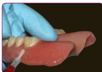
Bescherming van de randen met Reline II afwerkingsmateriaal