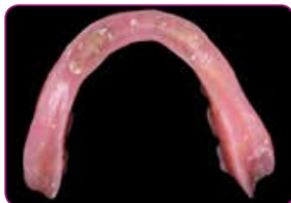
Eerste prothese die moet worden gerelined, als gevolg van het aanbrengen van 4 implantaten.