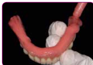
Breng GC RELINE II (Extra) Soft aan. De verwerkingstijd is 2'00".