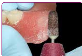
De randen kunnen verder worden beschermd met Reline II afwerkingsmateriaal

U kunt materiaal toevoegen binnen 3 maanden na de eerste applicatie, met het oog op veranderingen in de slijmvliezen en het bot. Dankzij de nieuwe Reline II Remover voor kunstthars kan de relinerlaag bijzonder snel worden verwijderd en vervangen.