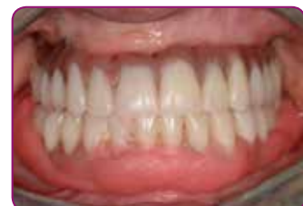
Plaats de prothese in de mond en laat de patiënt de functionele mondbewegingen maken. Laat op zijn plaats gedurende 5'00".