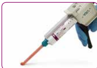
Gemakkelijke levering met cartridge.