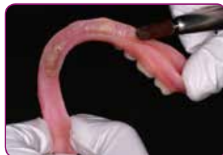
Beslijp het gebied dat moet worden gerelined en ruw het oppervlak op.