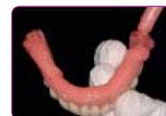
Nanijeti GC RELINE II (Extra) Soft. Vrijeme rada iznosi 2 minute.