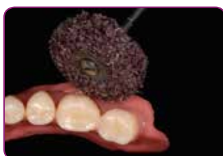
Rifinire con GC RELINE II WHEEL FOR FINISHING.