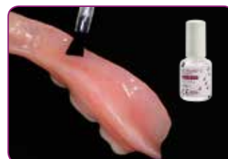
Applicare GC RELINE II PRIMER sull'area da ribasare. Asciugare con getto d'aria delicato.