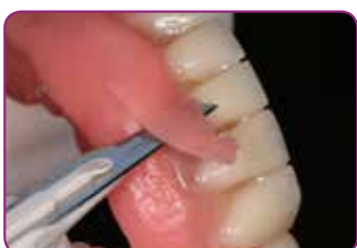
Eliminare il materiale in eccesso con un bisturi o con le forbici. Sgrossare con GC RELINE II POINT FOR TRIMMING.