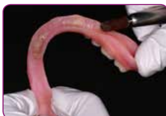
Ridurre l'area da ribasare e irruvidire la superficie.