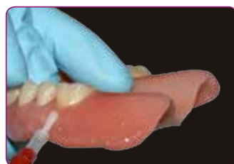
Dzięki materiałowi wykończeniowemu Reline II - Finishing krawędzie mogą być jeszcze lepiej chronione

Materiał pozostaje gładki i bezwonny oraz utrzymuje stabilność wymiarów i elastyczność przez wiele tygodni, a nawet miesięcy. Trwałe i wygodne rozwiązanie dla pacjentów użytkujących protezy.