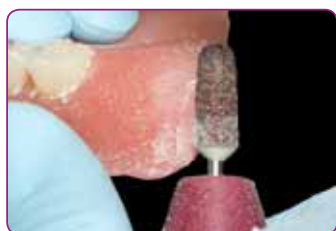
Ulepszona podatność na przycinanie zapewnia lepsze wykończenie krawędzi podścielenia

Jego ulepszona podatność na przycinanie sprawia, że ostateczne wykończenie krawędzi podścielenia jest teraz jeszcze łatwiejsze.