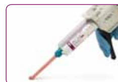
Enostavno rokovanje s kartušo v pištoli.