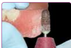
Izboljšana sposobnost prerezovanja za odlično končno oblikovanje robov

Po prvi aplikaciji lahko v roku treh mesecev še dodajate material , da se prilagaja na spremembe sluznice in kosti. Z novim GC Reline II odstranjevalcem za rezin je možno hitro odstraniti plast podložitve in jo nadomestiti z novo plastjo.