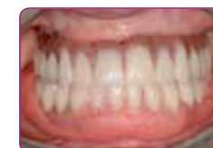
Vstavite protezo v usta in s sluznico oblikujte rob. Pustite na mestu 5 minut.