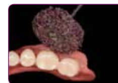
Končno oblikovanje z GC RELINE II KOLO ZA KONČNO OBLIKOVANJE.