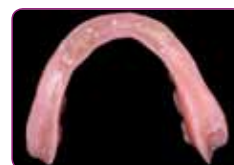
Prejšna proteza, ki se bo podlagala, po vstavitvi 4 implantatov.

Enostavna aplikacija & rokovanje, skozi celoten postopek