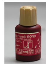
Table 1. Trial materials