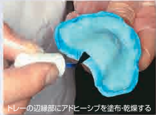
トレーの辺縁部にアドヒーズを塗布・乾燥する

Since 1921 100 years of Quality in Dental