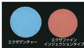
エクザデンチャー エクザフィン インジェクションタイプ