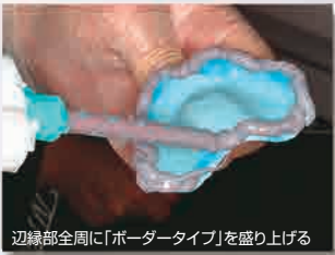
辺縁部全周に「ボーダータイプ」を盛り上げる