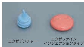
エクザデンチャー エクザフィン インジェクションタイプ