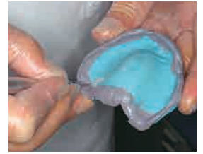
硬化後のトリミングも容易に行えます。