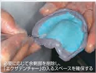
必要に応じて余剰部を削除し、「エクザデンチャー」の入るスペースを確保する