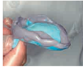
辺縁形成後の印象面。