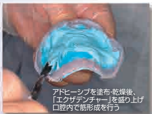
アドヒーズを塗布・乾燥後、「エクザデンチャー」を盛り上げ口腔内で筋形成を行う