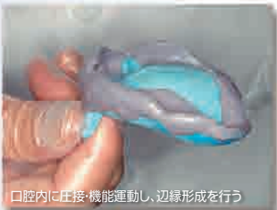
口腔内に挿入・機能運動し、辺縁形成を行う