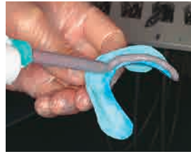
垂れることなく、均一な厚みに盛り上げられます。

エクザデンチャー ボーダータイプは辺縁形成に最適な印象材です。カートリッジタイプなので辺縁に均一な厚みで盛り上げることができるのはもちろんのこと、1回で全周に盛り上げられるため、治療時間が大幅に短縮でき、患者さんの負担も軽減されます。