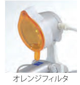
オレンジフィルタ

“EyeMag Smart” および “EyeMag PRO” に装着可能です。