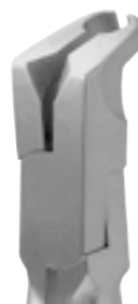
50-0678-220L Pince angulée à déposer les brackets (manches longs)