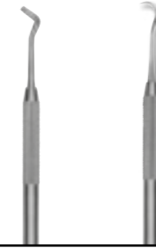
50-0678- BPS1 Instrument Shure