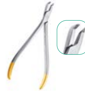
50-0678-7010 Pince coupante linguale pour ligatures