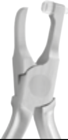
50-0678-2070 Pince à débayer mors longs. Contre-appui plastique 50-0678-0140/0360