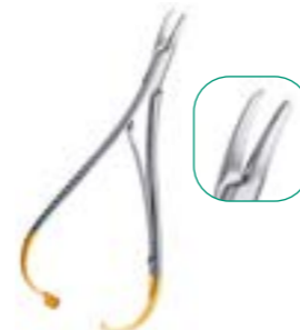
50-0678-7050 Pince Mathieu Linguale