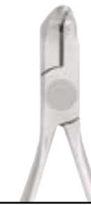
50-0678-101L Pince coupante distale de sécurité. Manches longs. Max .021" X .025"