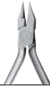
50-0678-3260 Pince bec d'oiseau (Effilée)