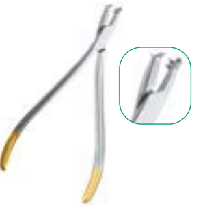
50-0678-704S Pince à plier le NiTi en dis- tal avec vis de blocage