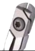
50-00SD-1010 Pince Coupante Gros Fils .045"