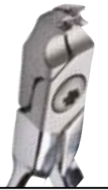
50-00SD-1302 Pince à sertir stops et cro- chets angulée