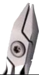
50-00SD-5050 Pince d'Adams