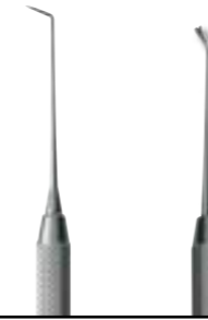
50-0678-FELD Sonde/Pousse ligature