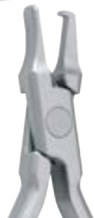
50-0YDM-4500 Pince pour création de force horizontale