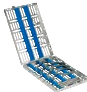
50-0000-ORT1 Cassette de Stérilisation