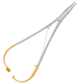
50-NH50-74E0 Pince Mathieu