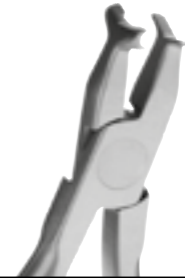
50-0678-5020 Pince à plier distale "Re- quin Marteau". Fine