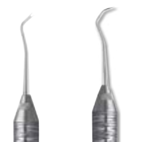
50-0678-7060 Pousse-ligature lingual