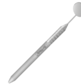
50-0678-MHE6 Manche / Unité 50-0678-M4C0 Mirroirs / Par 12