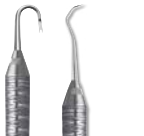
50-0678-7070 Pousse-ligature lingual Forme en U