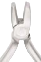
50-0678-3170 Pince Hollow Chop "de la Rosa". Mors courts