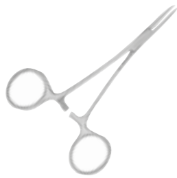
50-0678-H400 Pince Mosquito