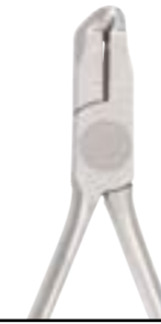
50-0678-1010 Pince coupante distale de sécurité. Max .021" X .025"