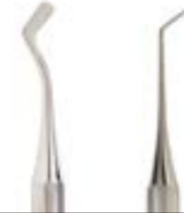
50-0032-0000 Bord large pour ouvrir les EXPERIENCE mini metal par le bord vestibulaire et embout fin pour l'ouverture des EXPERIENCE metal et ceramic par le bord gingival