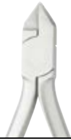
50-0678-3220 Pince 3 becs pour NiTi