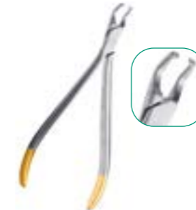
50-0678-7030 Pince à déposer les brackets Linguaux