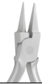
50-0678-3050 Pince bec d'oiseau longue, pour fil fin, avec rainure