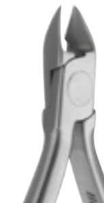
50-0678-5000 Mini-pince coupante pour ligatures. Fine . Max .012"