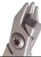
50-00SD-2000 Pince 3 becs Aderer