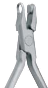
50-0YDM-4510 Pince pour création de découpe large