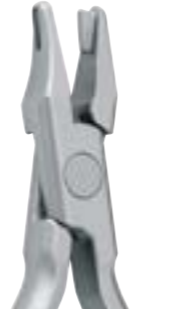
50-0YDM-4480 Pince pour création de découpe étroite