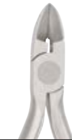
50-0678-1030 Pince coupante gros fils angulée 15°. Max .022" X .028"