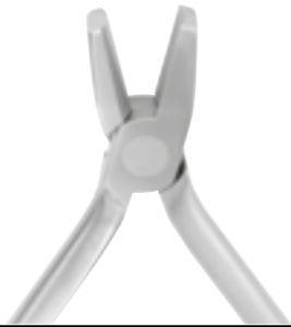
50-0678-3100 Pince Hollow Chop "de la Rosa"