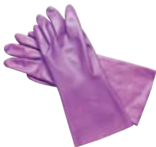
50-0040-0620 Gants de protection (Chimique et perforation) Taille M

Pour vos solutions de stérilisation en cassettes, prenez rendez-vous avec votre représentant pour une présentation de la game en rapport avec vos besoins.