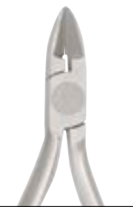
50-0678-1070 Pince coupante pour ligatures et micro pins Max .012"