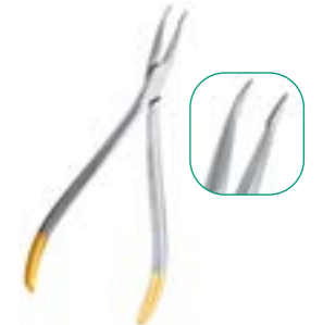
50-0678-7020 Pince Weingart linguale