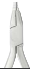
50-0678-3240 Pince Tweed Loop Old Style