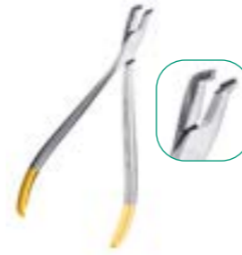
50-0678-7000 Pince coupante distale lin- guale