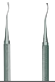
50-0678-LDG2 Pousse ligature double