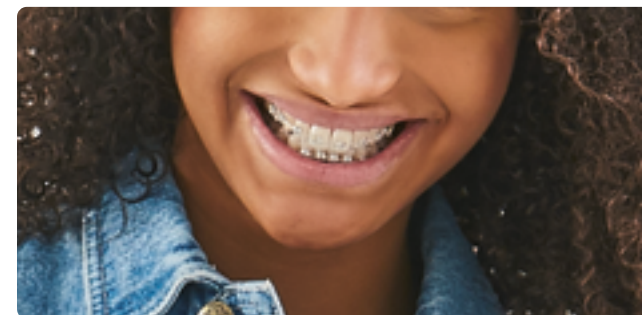
Rh LEGEND mini Rhodium

Ihr Kieferorthopäde wird Sie bezüglich der zu Ihnen passenden Behandlungsmethode beraten.